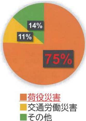
運送業の労働災害の内訳

陸上貨物輸送事業(トラック輸送事業)における労働災害は、 荷役作業中に発生したものが全体のおよそ7割 を占めています。また「トラック荷台からの転落等による災害データ」のうち トラック荷台等への昇降時に発生するものが約4割 を占め、とりわけ荷台から降りる時が約3割となっています