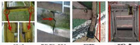
クラック 足元変形、穴あき 支柱変形 ゆがみ等

無料で専門スタッフがまるごと点検・診断いたします。 職場の安全と安心を確保するために、是非この機会を ご利用下さい。