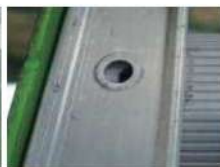
リベットの抜け落ち