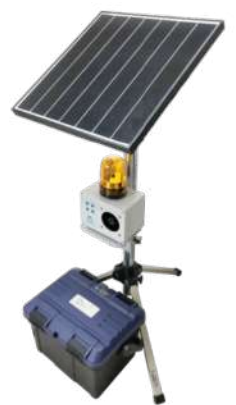
型式 VTS-SBB-12 (警報器用80Ah)