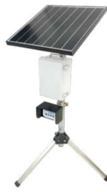
型式 VTS-SBB-11 (センサー用14Ah)