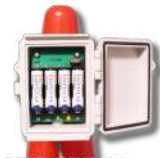
型式 VTS-SBB-01 (単一 VTS-SBB-02)