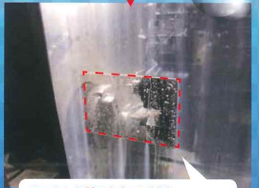
フィルムを貼ったところだけ、 はじいてよく見えるようになっています