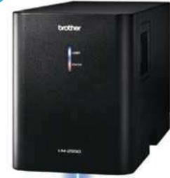
ブラザー製 YAG レーザーマーカ- LM-2550

行えるブラザー製YAGレーザーマーカ- LM-2550を特別価格でご提供。対象物への熱影響を抑え、凹凸が少なく美しいマーキング・刻印が特徴です。レーザーマーカ-導入にあたり、価格がネックだったユーザーさまへもぜひご検討ください。