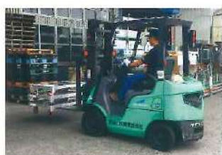
フォークリフトで差込んで運搬もできます。