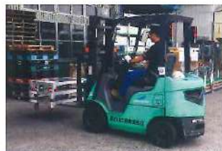
フォークリフトで差込んで運搬もできます。