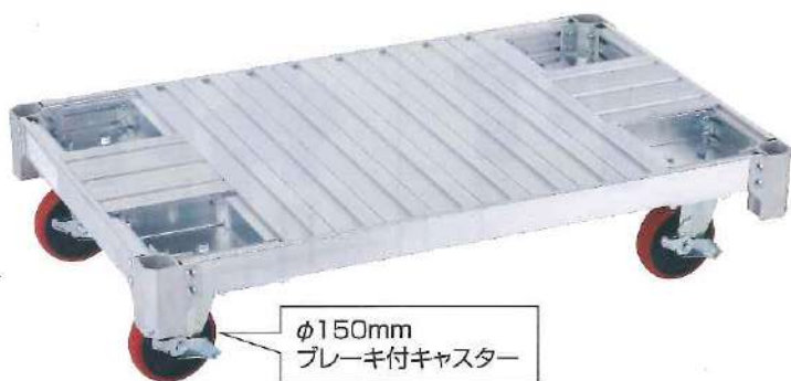
φ150mm ブレーキ付キャスター