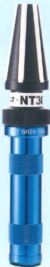
ナショナルテーパ (NT)