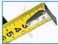
3点カシメプロテクターにより 爪飛び耐久性アップ!