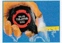
濡れた手でも扱いやすい エラストマーカバー (GASFGSLM25-50のみ)