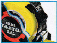
水周り作業に最適な ステンレスバネ採用