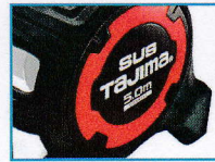
暗い場所でも目立つ 蛍光レッドのリングデザイン