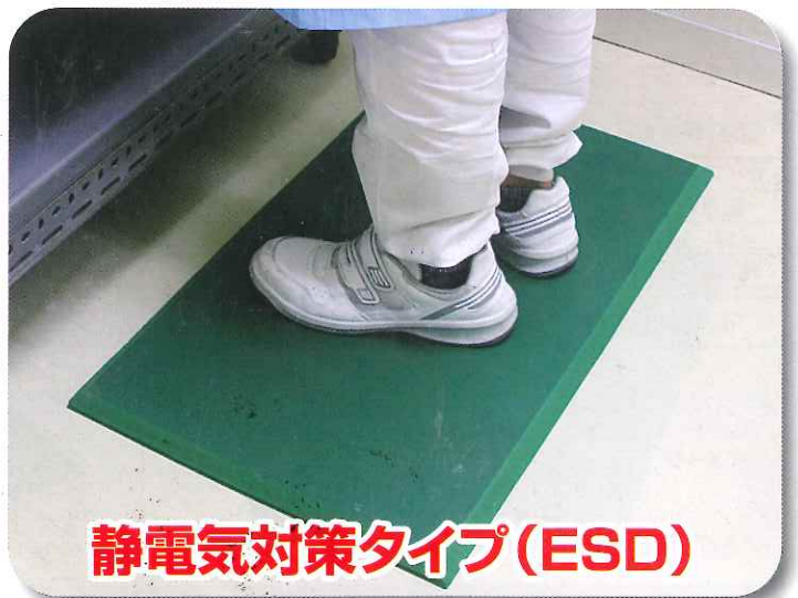
静電気対策タイプ(ESD)