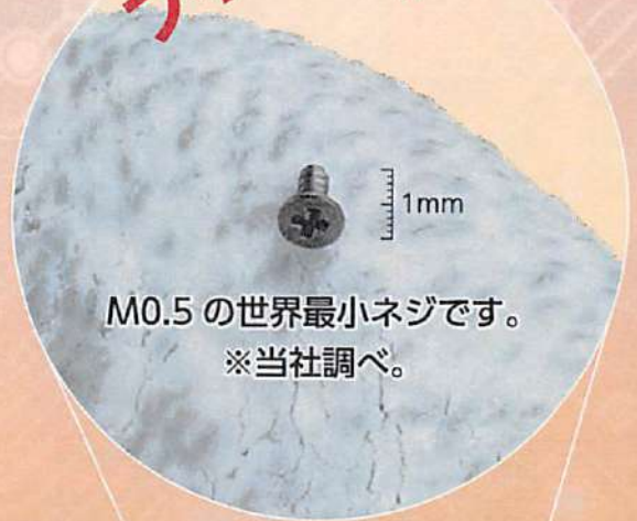
M0.5の世界最小ネジです。 ※当社調べ。