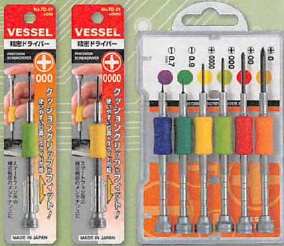
TD-51 +000 TD-51 +0000

樹脂グリップをしっかりと 押さえて回してください。 ※使用温度によって樹脂グリップが 硬くなる場合があります。