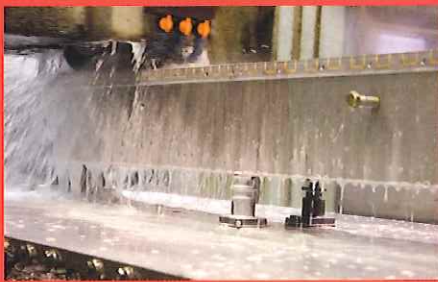
ワークのオーバーハンク部や研削加工時の中空部をサポート。